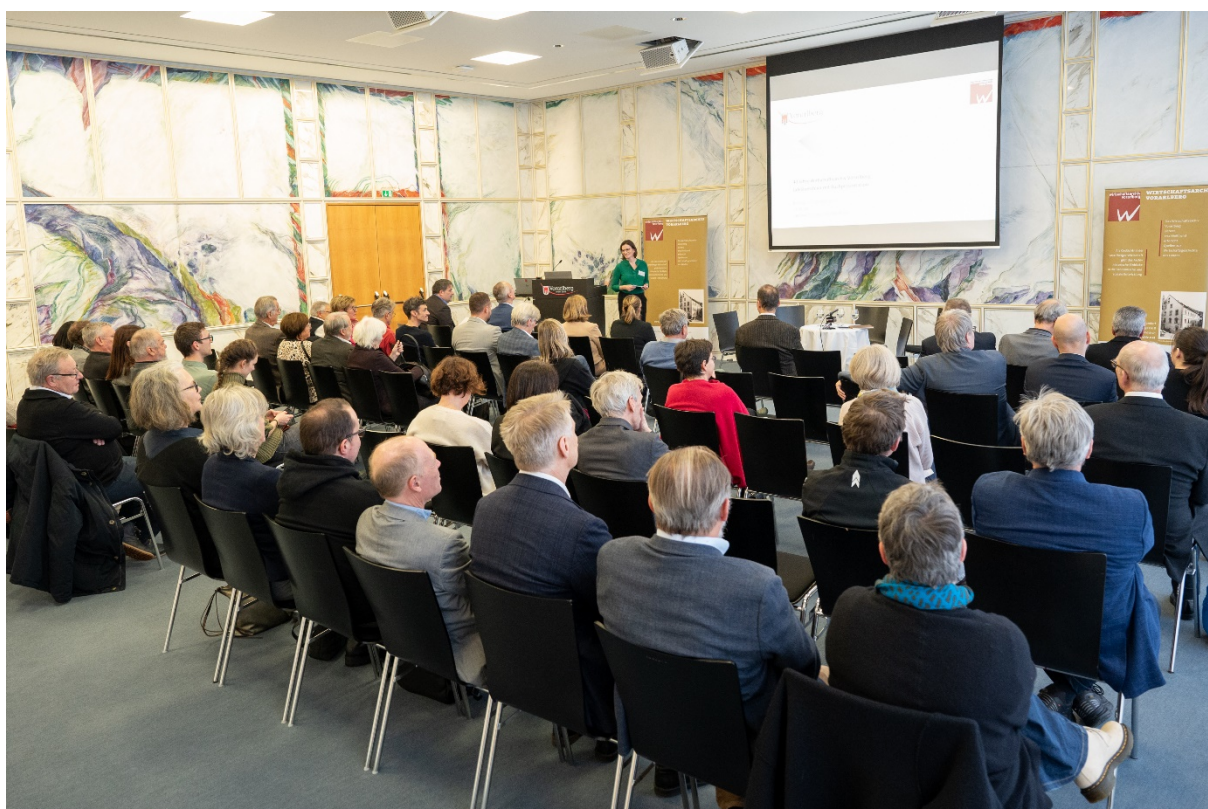
Die Jubiläumsveranstaltung zum 40-jährigen Bestehen des Wirtschaftsarchivs Vorarlberg im Montfortsaal des Vorarlberger Landhauses im Dezember 2023