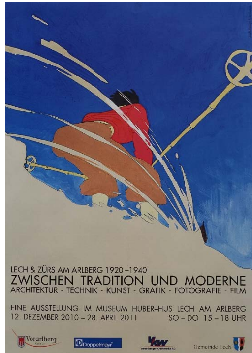
Plakat aus der Schenkung des Lechmuseums (Ausstellung 2010/11)