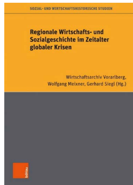
Das Cover des Jubiläumsbandes, der als Band 41 der Sozial- und wirtschaftshistorischen Studien präsentiert wurde